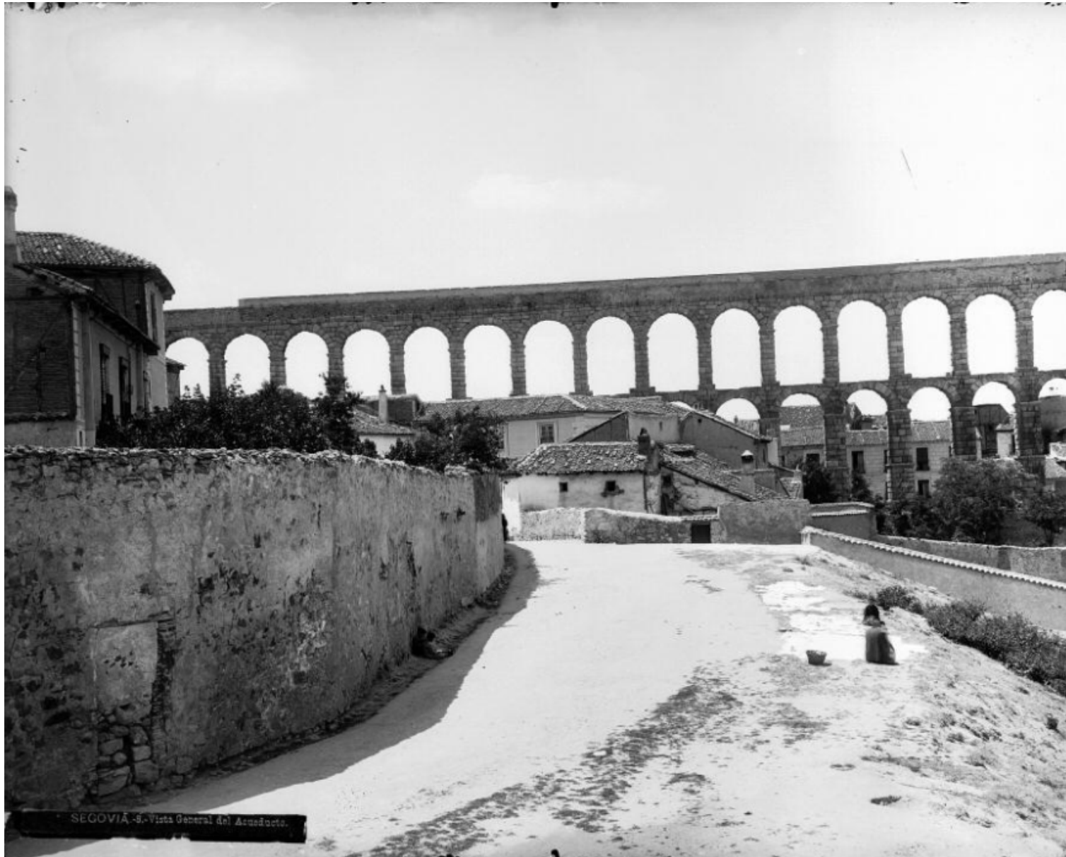
SEGOVIA - 8. - Vista General del Acueducto.