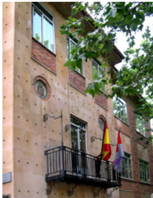
Detalle de la fachada