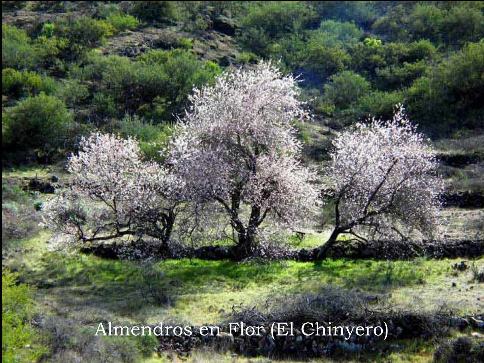
Almendros en Flor (El Chinyero)