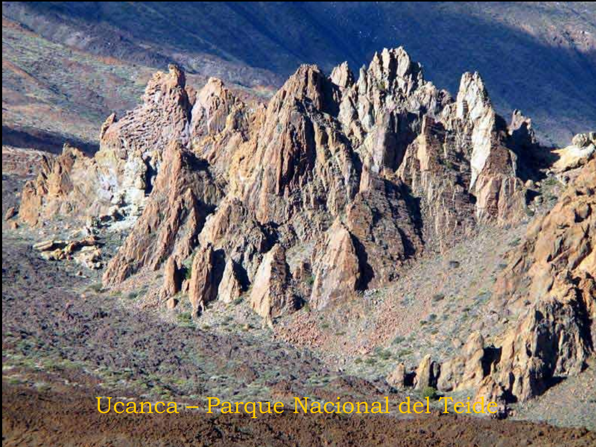
Ucanca – Parque Nacional del Teide