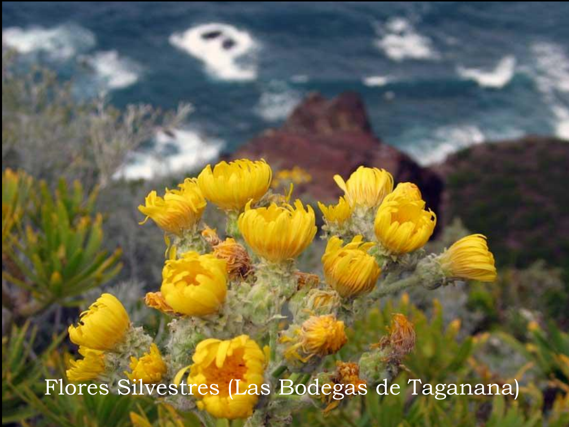
Flores Silvestres (Las Bodegas de Taganana)