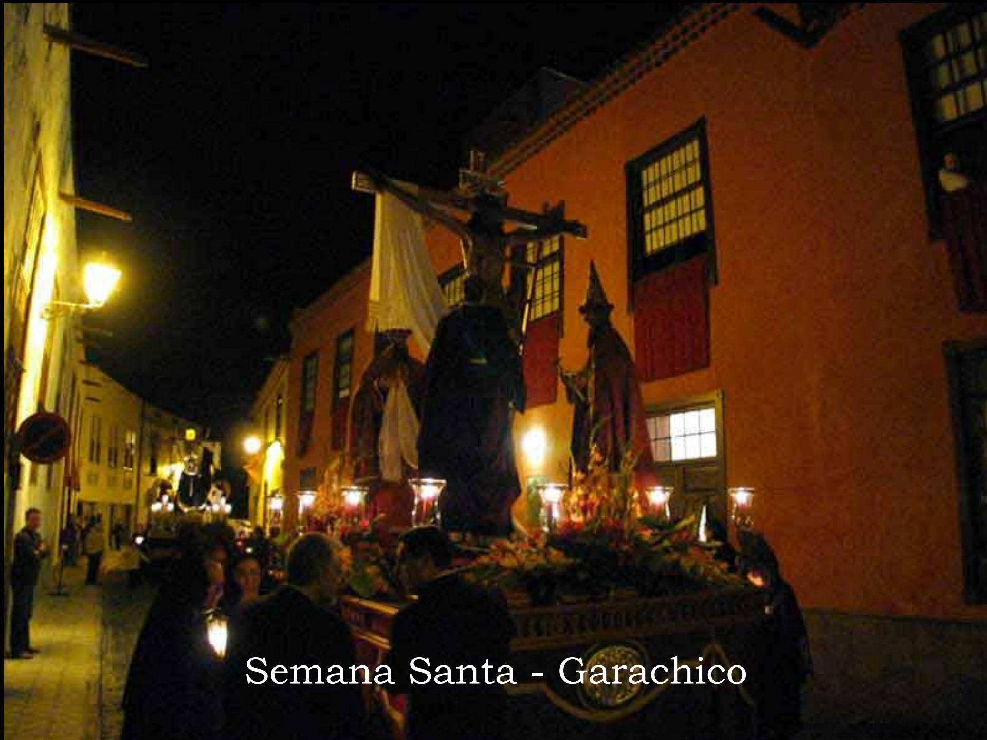
Semana Santa - Garachico