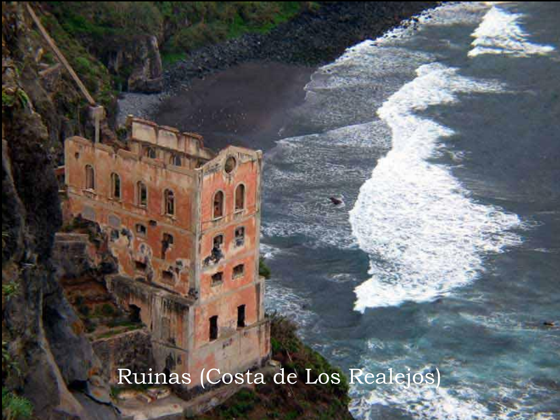
Ruinas (Costa de Los Realejos)