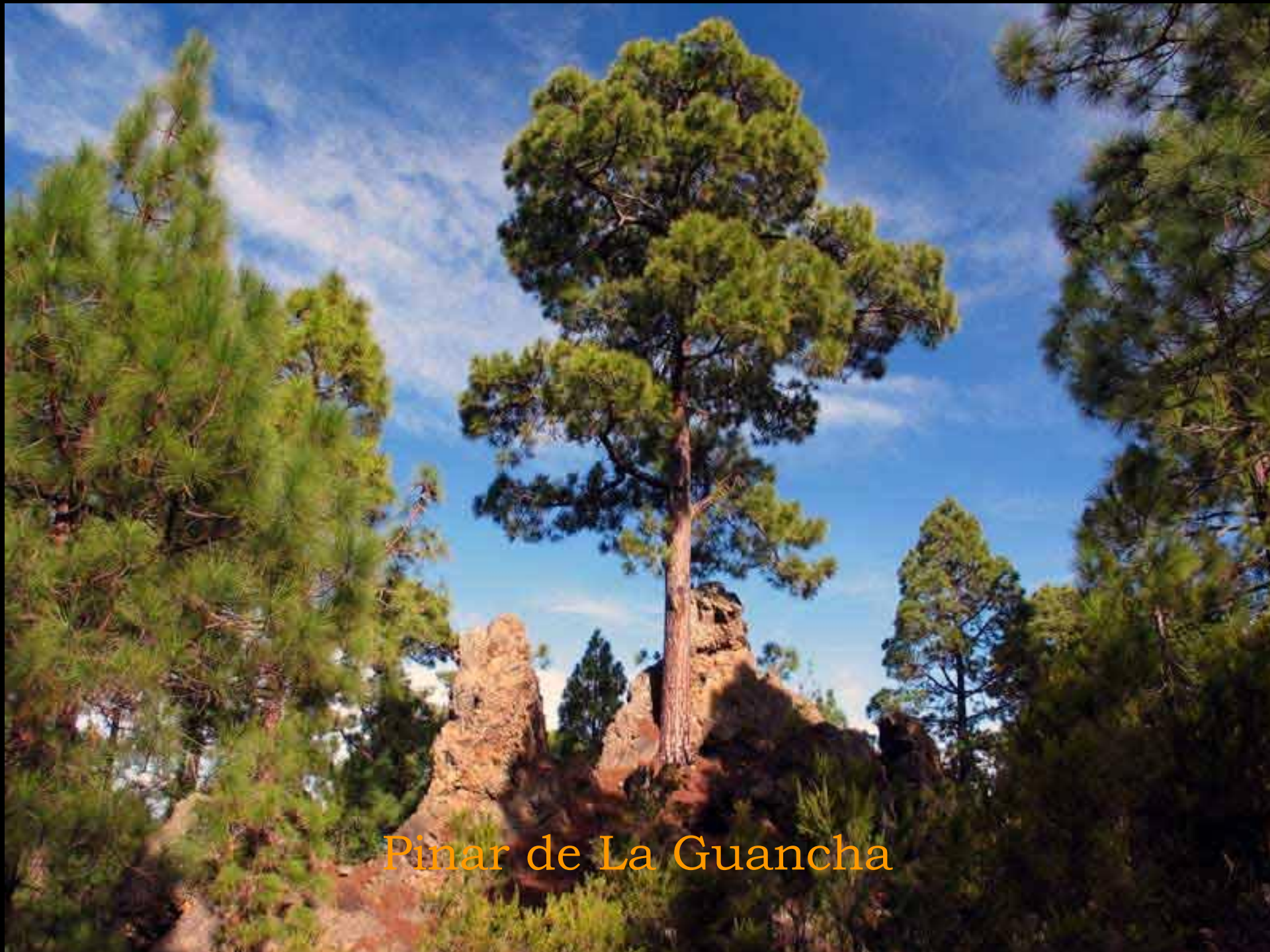
Pinar de La Guancha