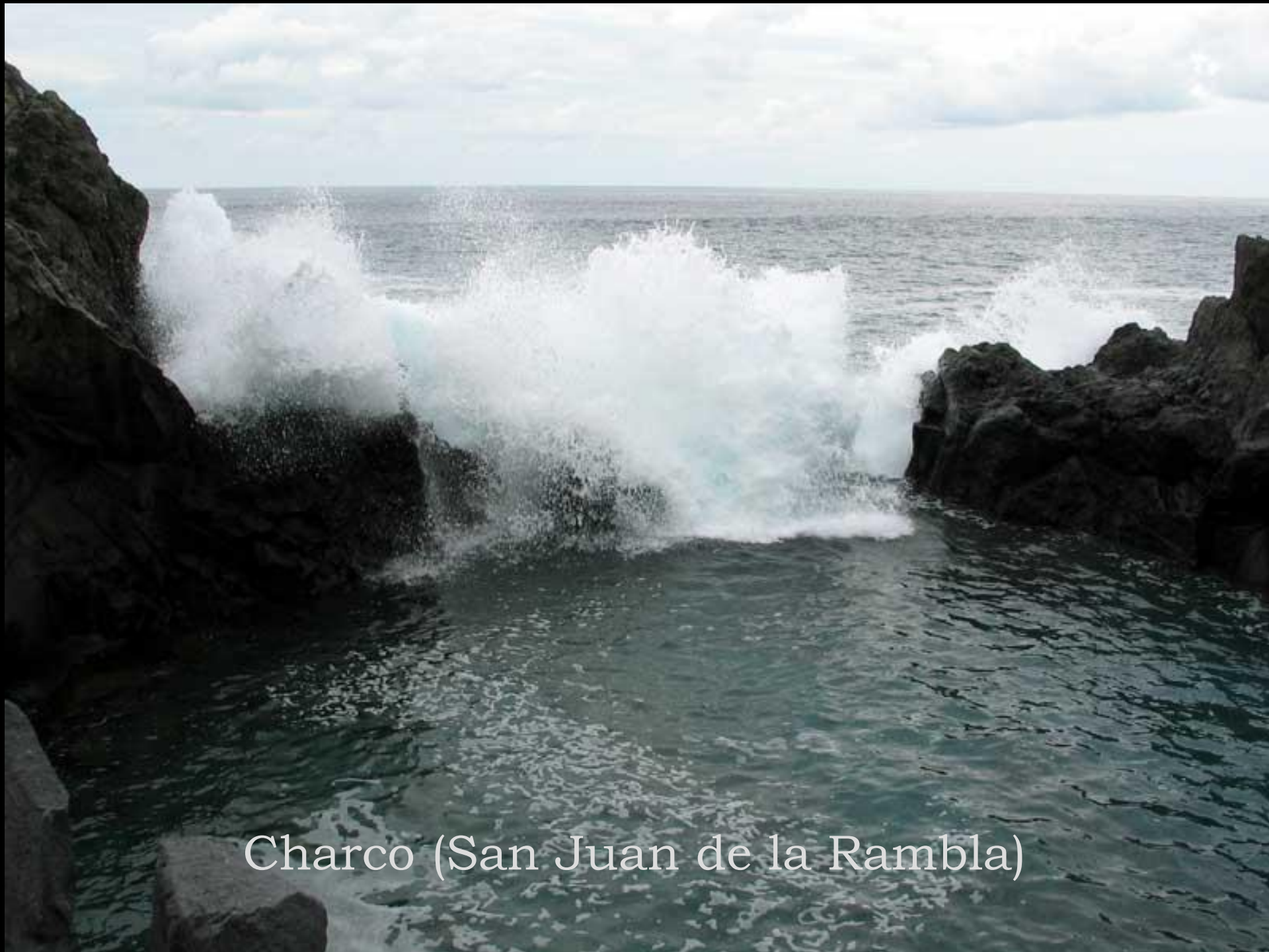
Charco (San Juan de la Rambla)