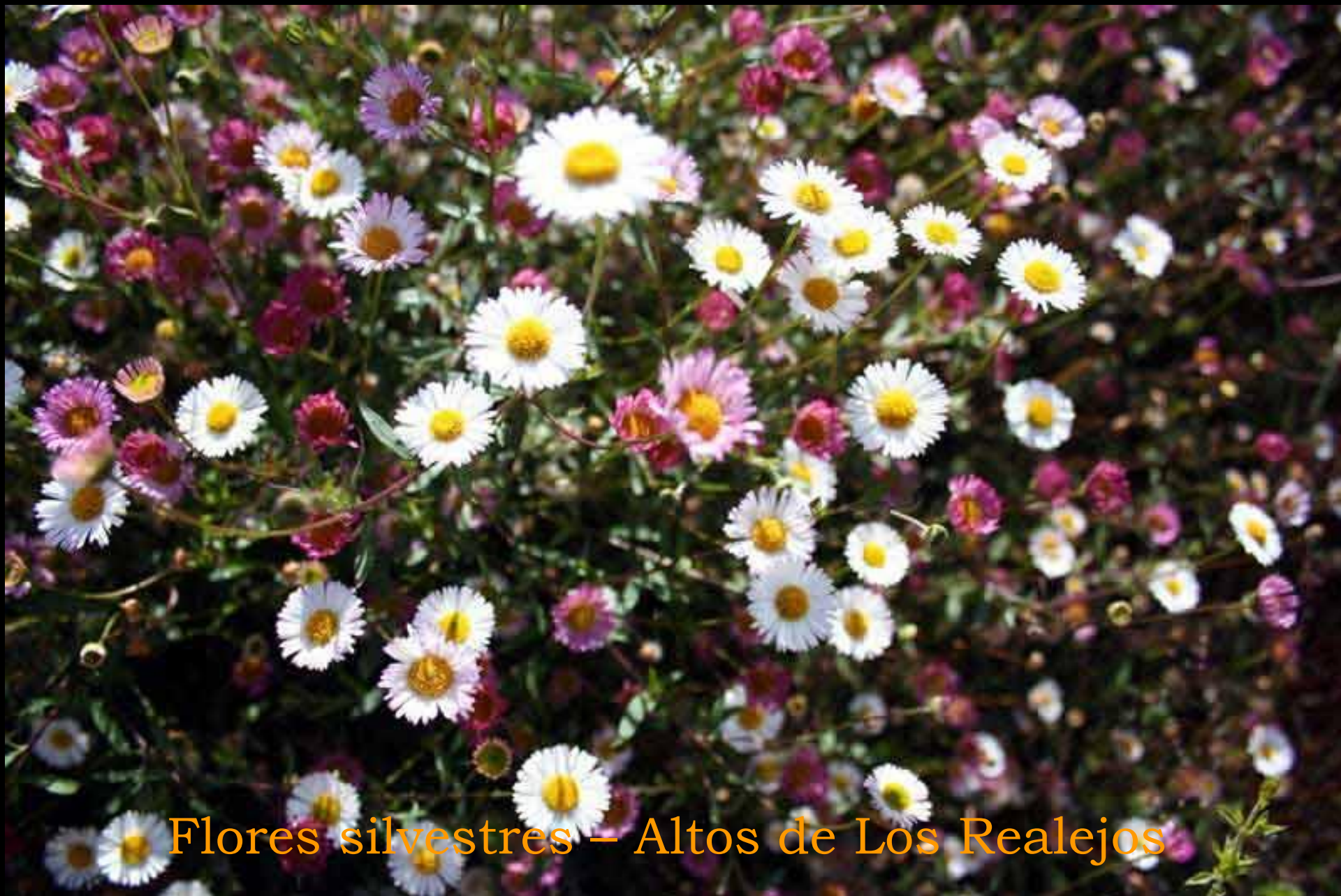
Flores silvestres – Altos de Los Realejos