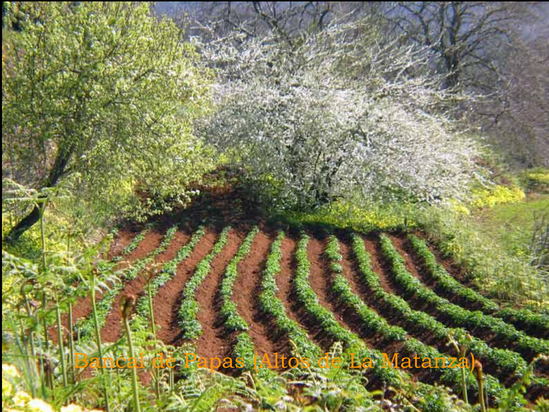
Bancal de Papas (Altos de La Matanza)