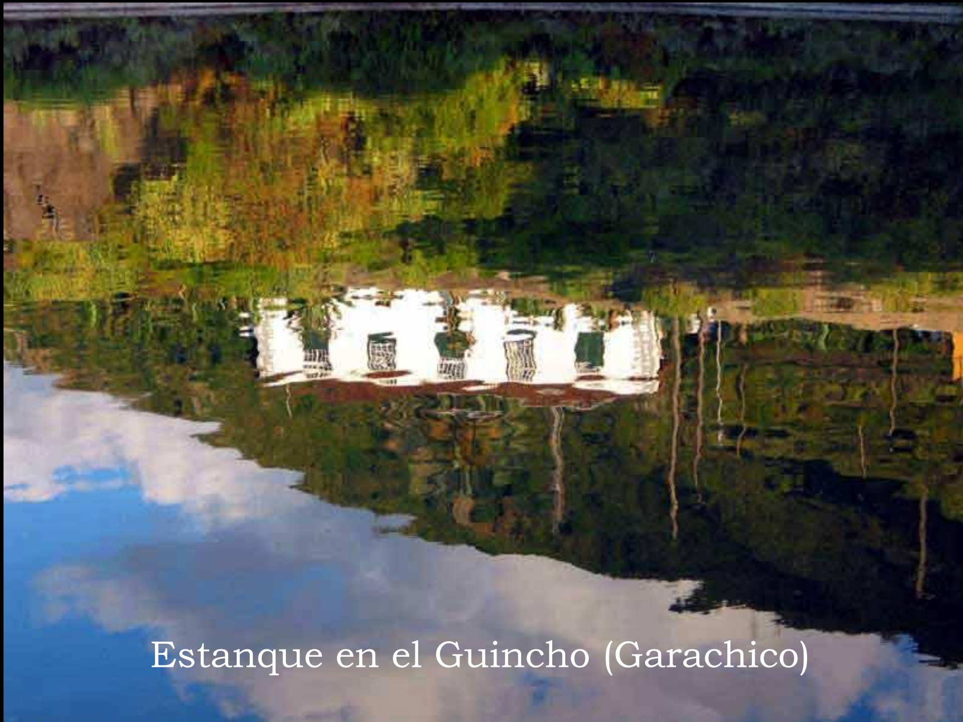
Estanque en el Guincho (Garachico)