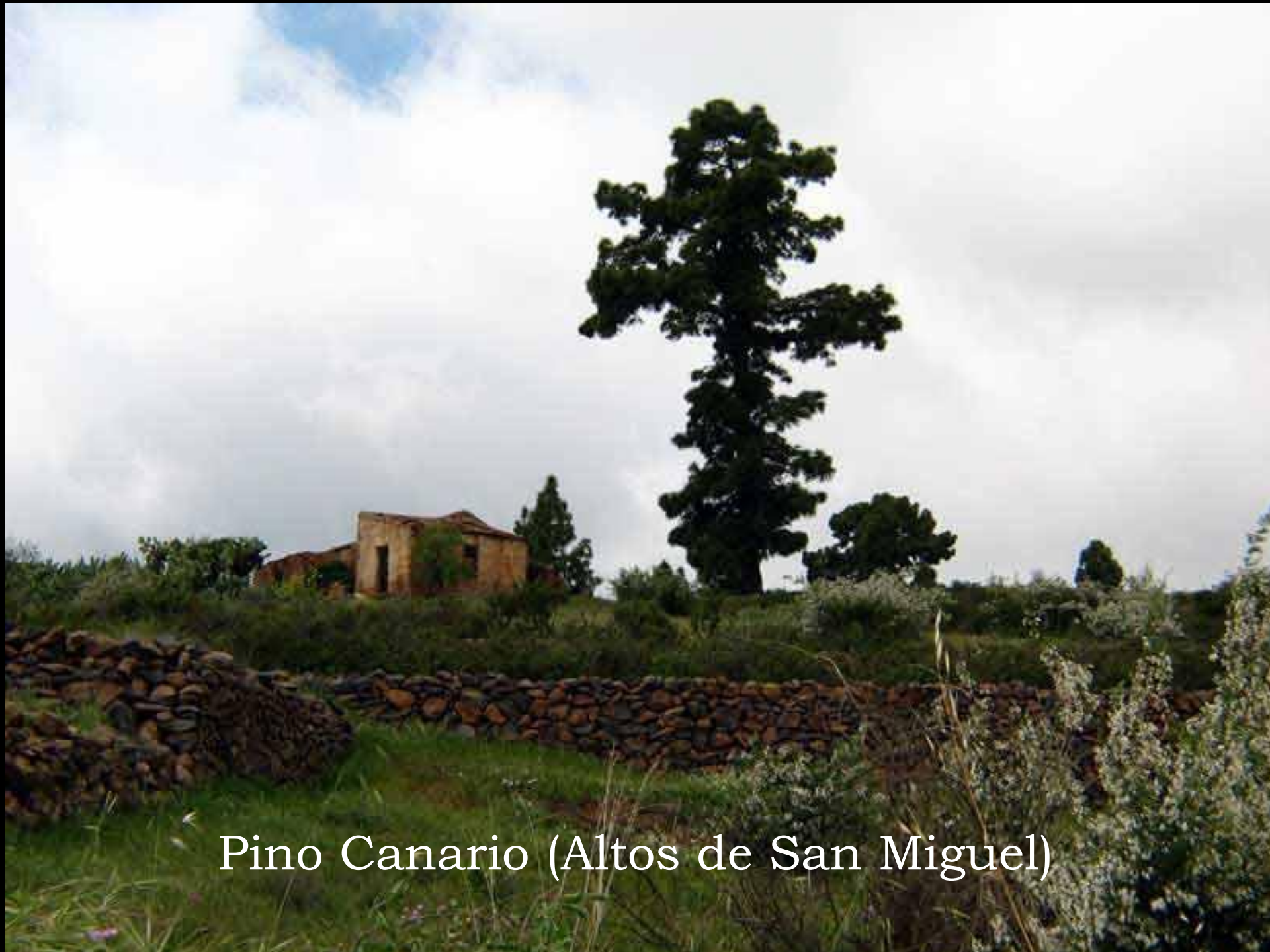
Pino Canario (Altos de San Miguel)