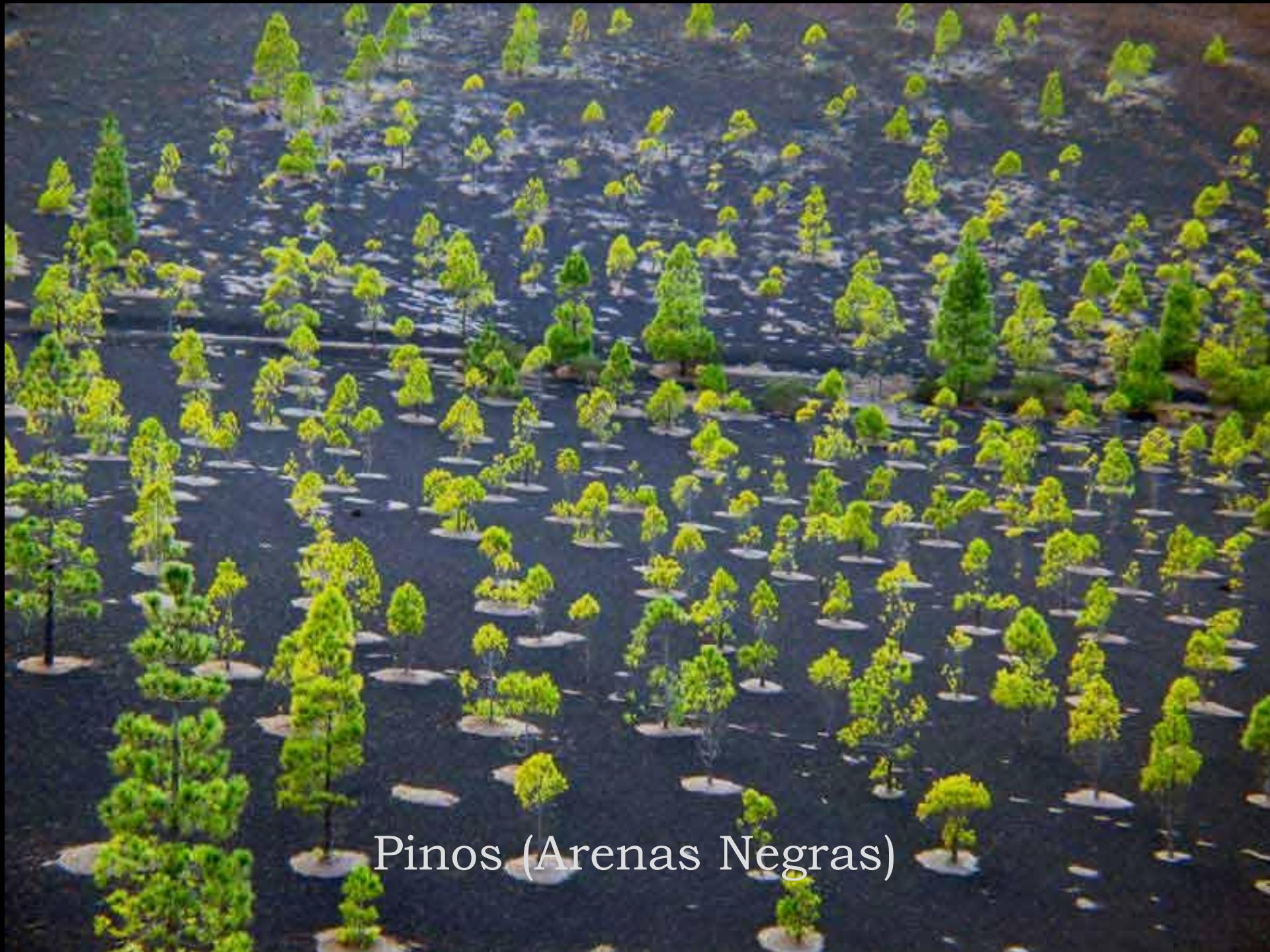
Pinos (Arenas Negras)