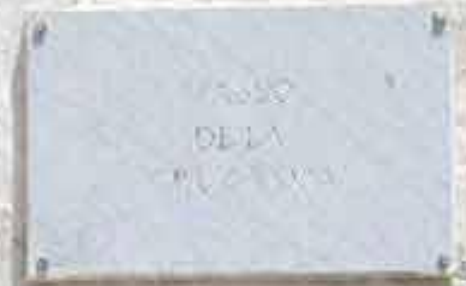
Ventana – Puertito de Güimar