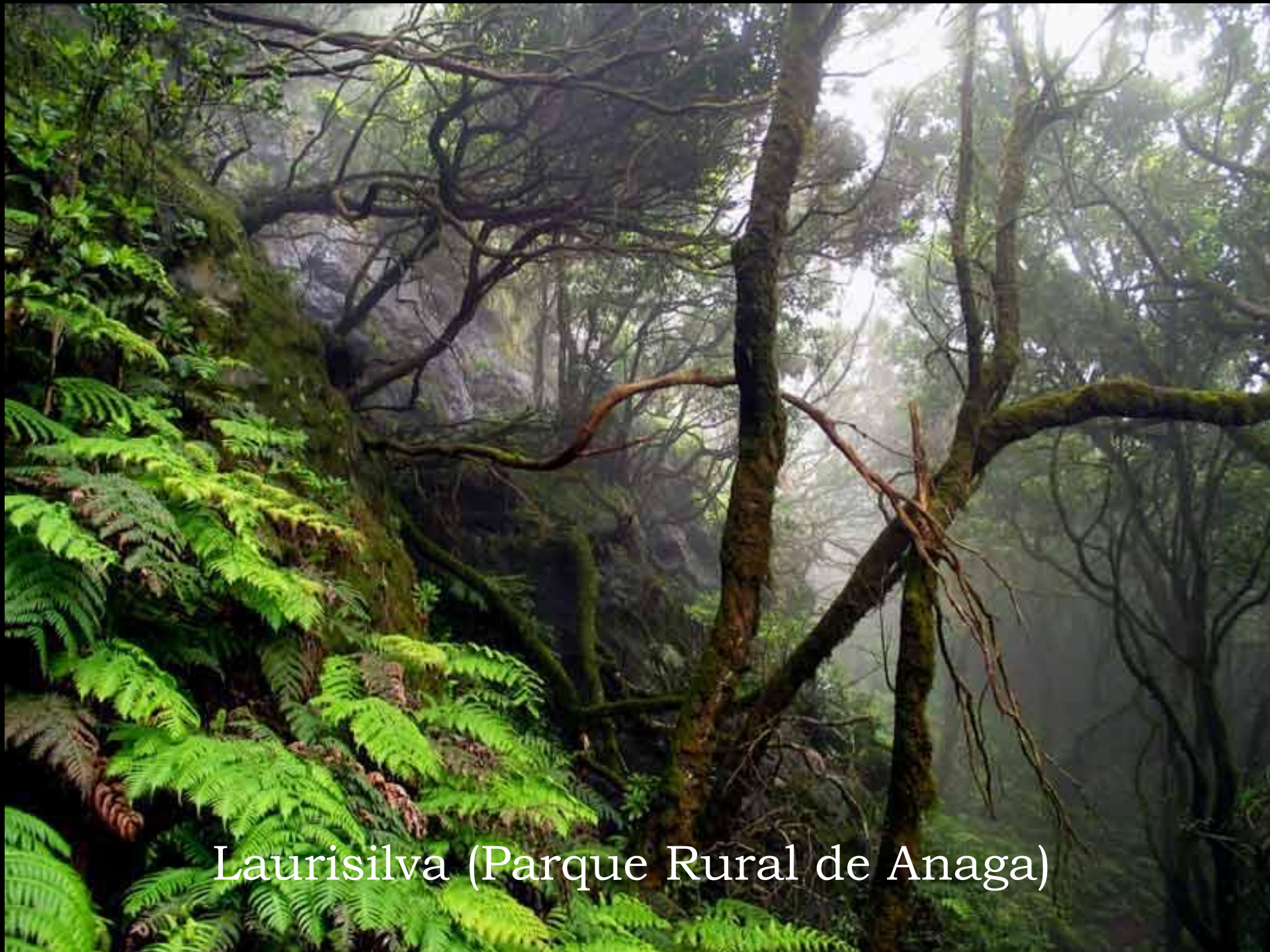
Laurisilva (Parque Rural de Anaga)