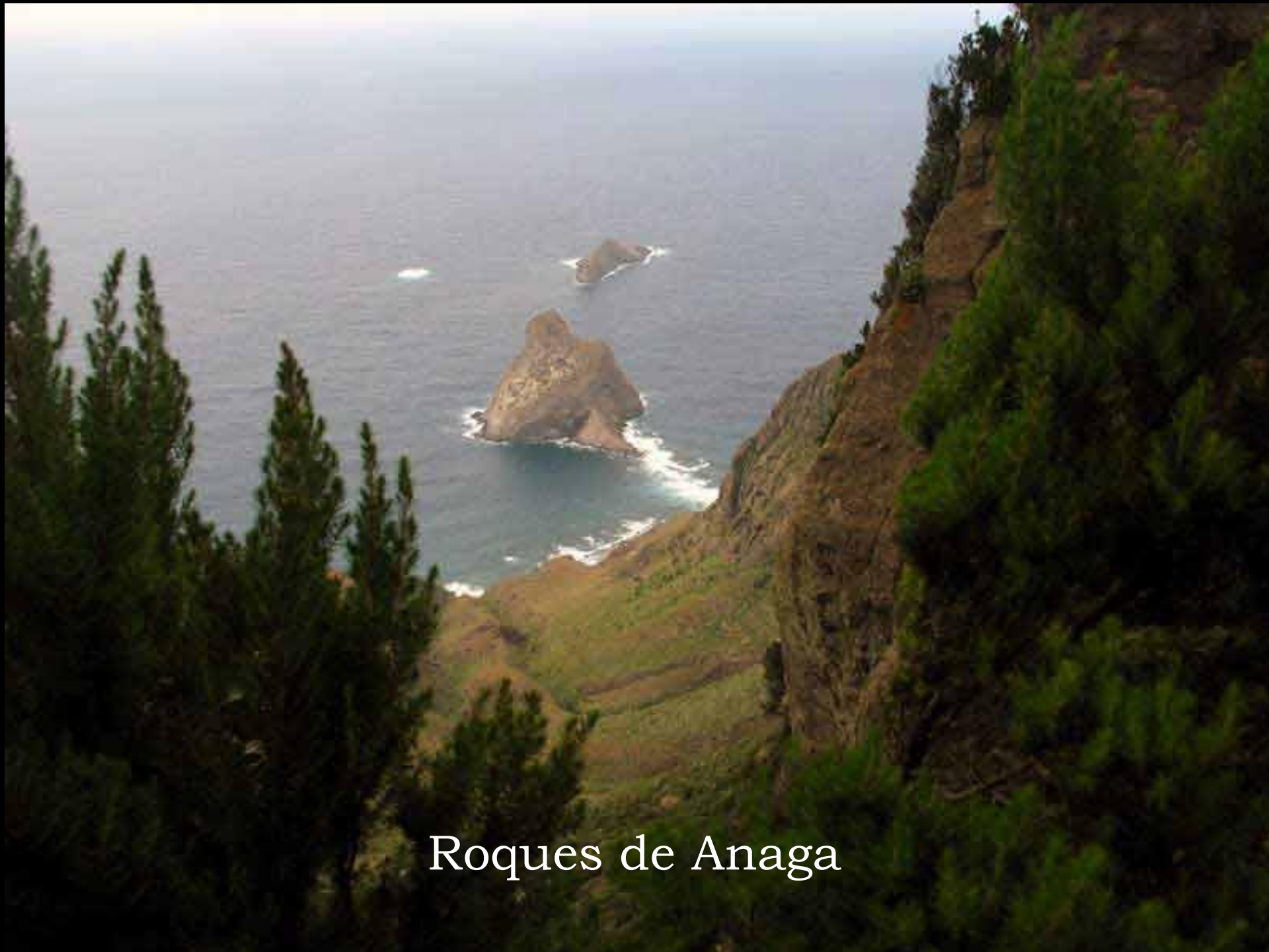
Roques de Anaga