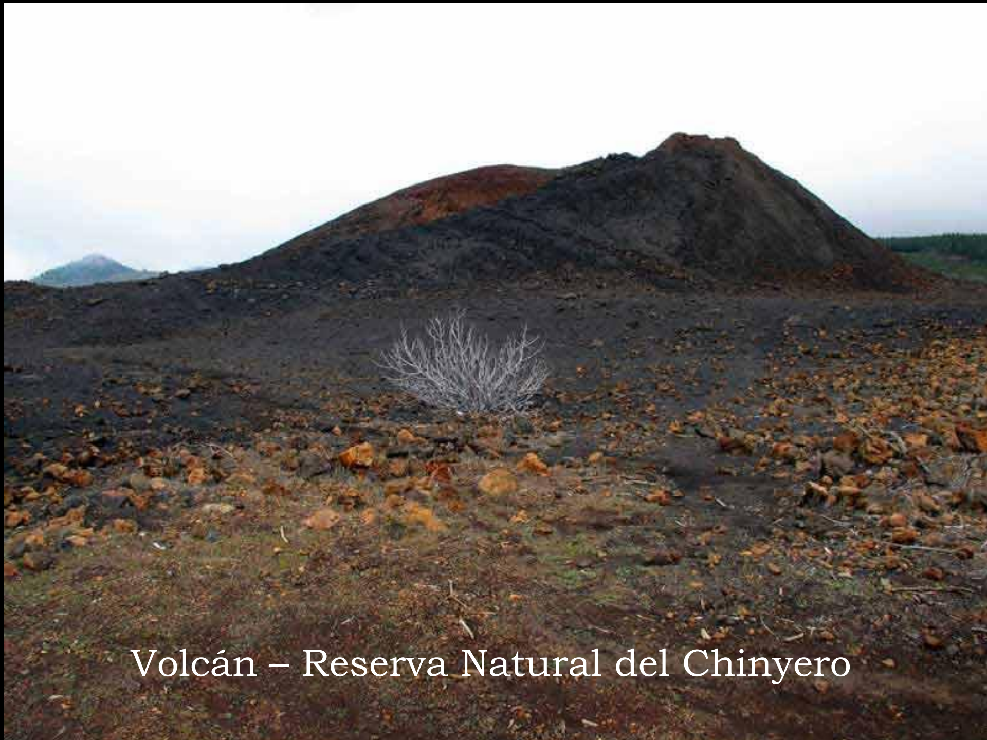
Volcán – Reserva Natural del Chinyero