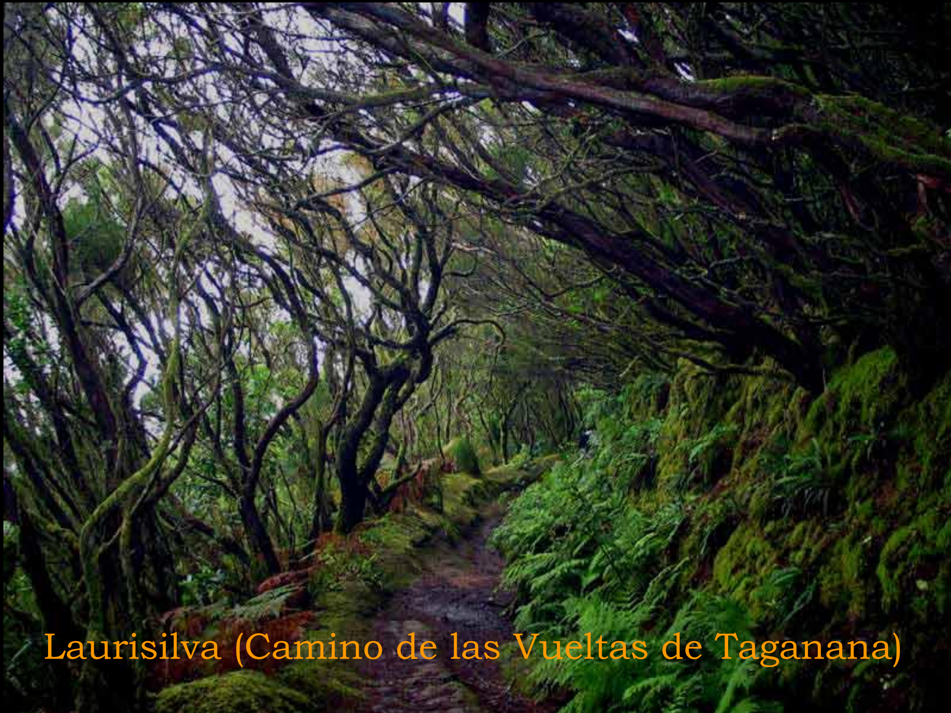
Laurisilva (Camino de las Vueltas de Taganana)