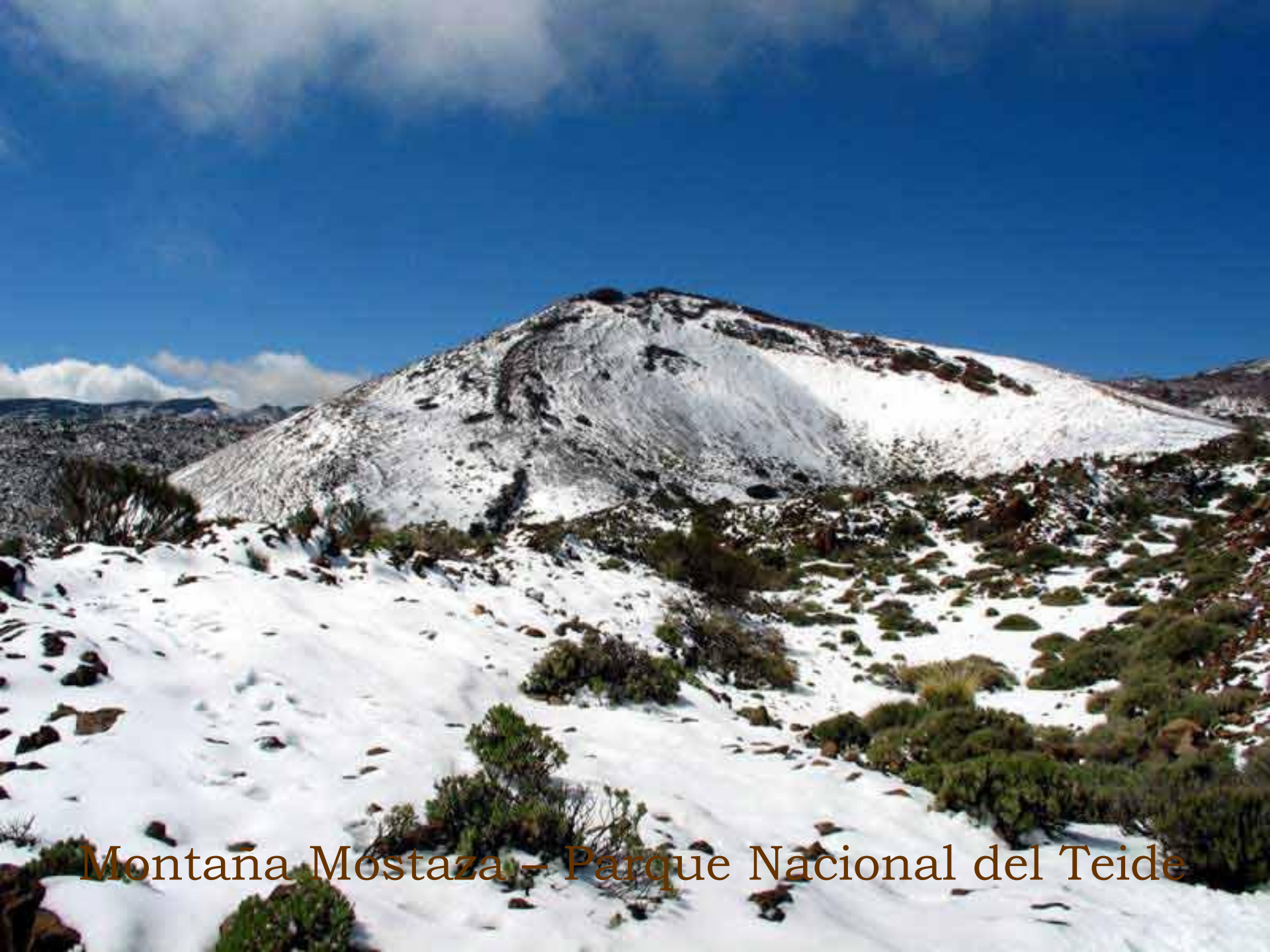
Montaña Mostaza - Parque Nacional del Teide